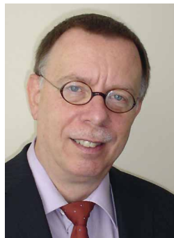
Klaus Hölzel Apotheken Management-Institut GmbH

Anknüpfend am Erfolg des letztjährigen Finanz-Gipfels geht es diesmal am 20. November in Rheine (Westfalen) wieder ums Geld – direkt und klar. Praxiserfahrene Referenten und eine breite Themenpalette machen den Finanz-Gipfel zu einem Muss-Termin – für alle, die ihre Apotheke auf den aktuellen Stand bringen wollen. Für die wichtigsten Berater des Apothekers, wie den Steuerfachmann, und natürlich für den Inhaber selbst. Wer aus einem Minus ein finanzielles Plus machen will, ist ganz herzlich eingeladen.